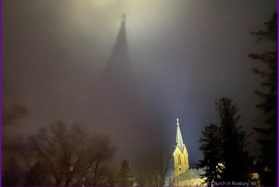
St. Norbert Church in Roxbury, WI